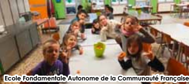
Ecole Fondamentale Autonome de la Communauté Française

Depuis le mois de janvier, chaque jour l'école procède à une distribution gratuite de fruits et/ou de légumes afin de garantir le bien-être des enfants et d'accroître leur potentiel santé. Ceci s'inscrit dans le projet d'éducation à la santé de l'établissement en collaboration avec la Région Wallonne qui subsidie l'action. Chaque jour les enfants dégustent des fruits et/ou des légumes différents, ils rencontrent des saveurs nouvelles et des parfums oubliés ;